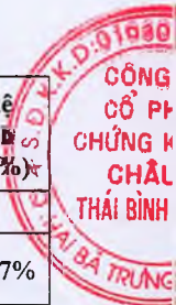
Bảng 2.1. Chênh lệch LNST trong kỳ báo cáo có sự chênh lệch trước và sau kiểm toán từ 5% trở lên